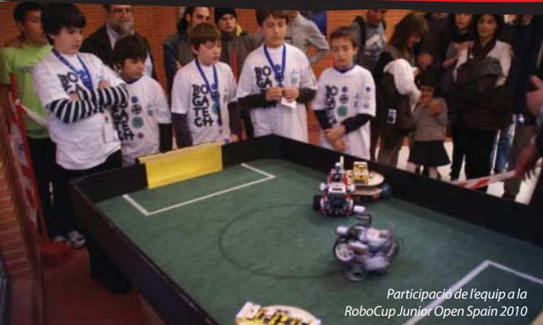
Participació de l'equip a la RoboCup Junior Open Spain 2010